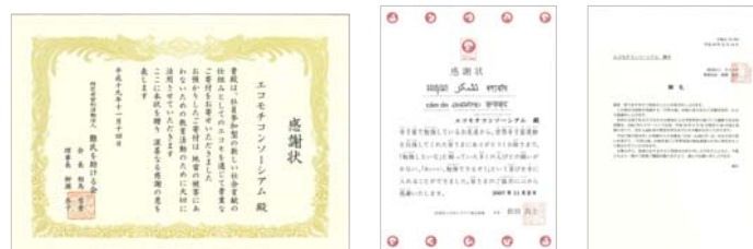
▲寄付先の NGO 団体よりいただいた感謝状、御礼状

【テストランニング実施企業】味の素株式会社、NEC パーソナルプロダクツ株式会社、小林クリエイト株式会社、株式会社 JTB 関東、積水化学工業株式会社、ソニー株式会社、株式会社ソニー・ミュージック コミュニケーションズ、トステム株式会社、株式会社フルハシ環境総合研究所